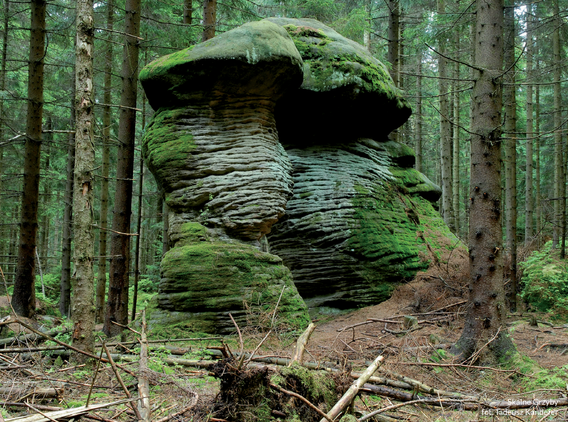
Skalne Czyby