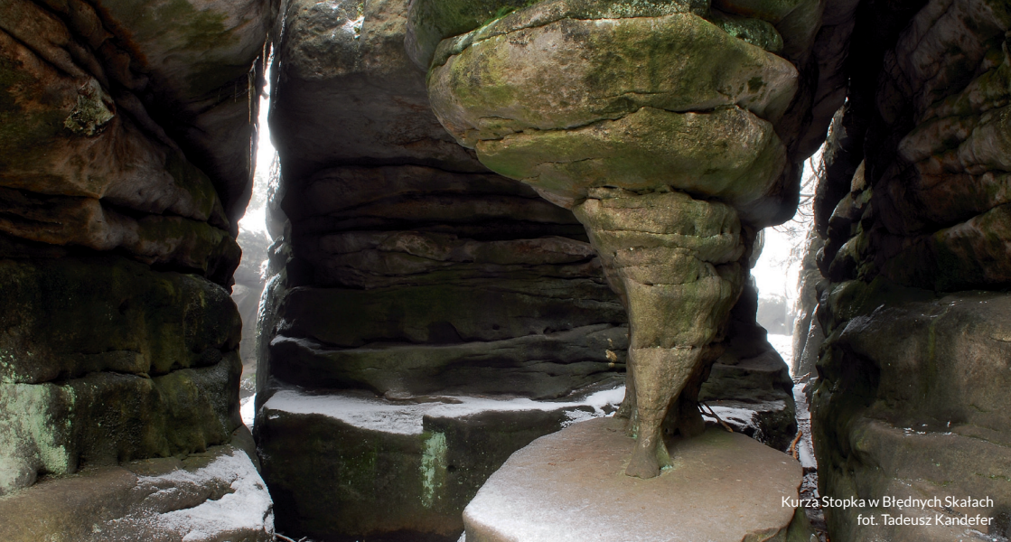
Kurza Stopka w Błędnym Skalach