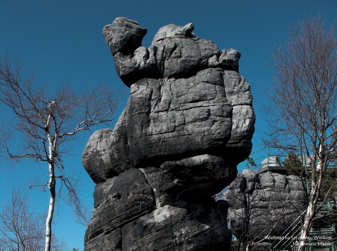
Wielbłąd na Szczelińcu Wielkim