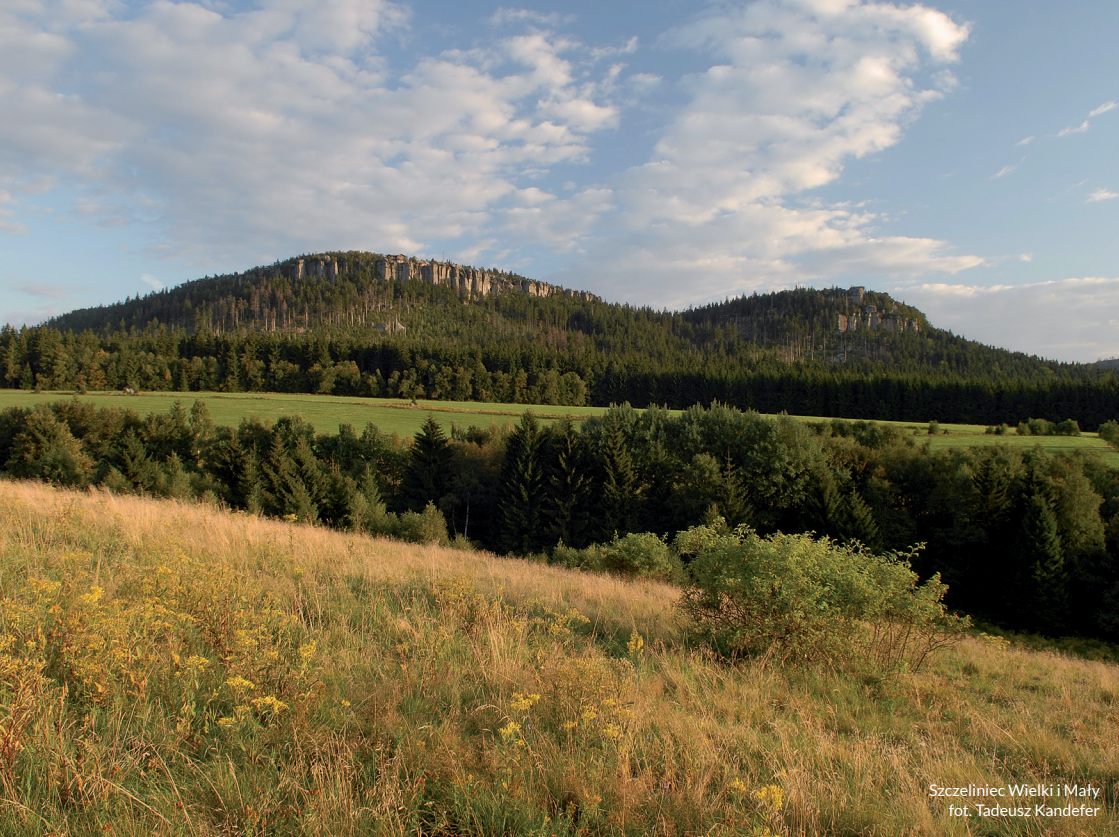
Szczelińiec Wielki i Mały